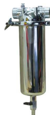
nerezová filtr. vložka